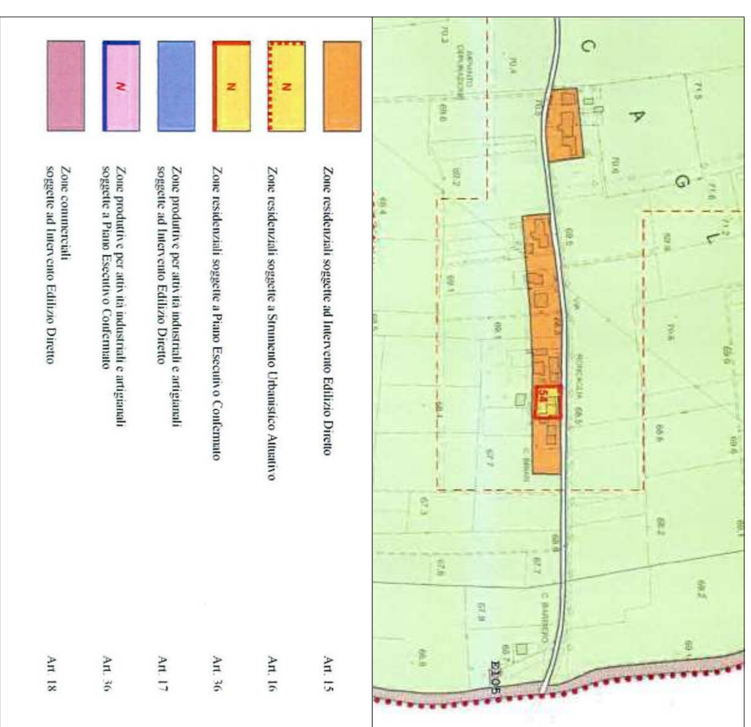
ESTRATTO P.I. VICENTE